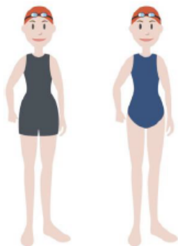
Figura 2. Exemplificação sobre os fatos permitidos para os nadadores cadetes e infantis femininos.